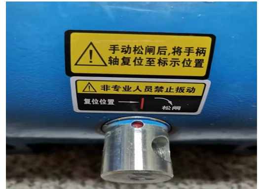
图 3 手动松闸复位警示标签